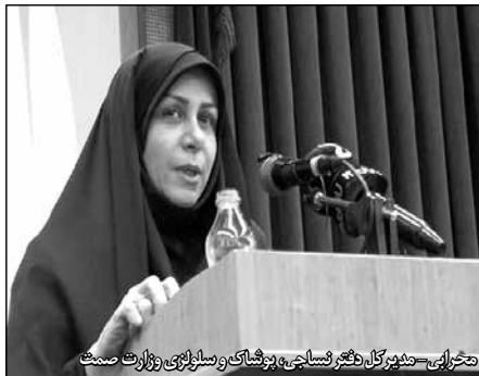
مخبرای - مدیرکل دفتر نساجی، پوشاک و صنایع وزارت صمت