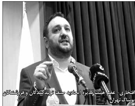
افتخاری - عضو هیئت مدیره اتحادیه صنف تولیدکنندگان و فروشندگان پوشاک تهران