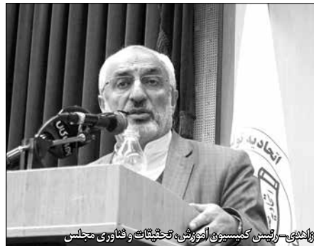
زاهدی - رئیس کمیسیون آموزش، تحقیقات و فناوری مجلس