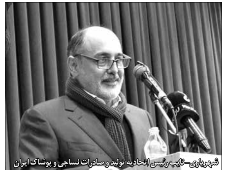
شهریاروی - نایب رئیس اتحادیه تولید و صادرات نساجی و پوشاک ایران

بود آزمون و خطا، زمان بر است و چه بسا سازمان را ناپود نماید لذا تئوری «جهانی شدن» شکل گرفت. این تولیدکننده خاطر نشان ساخت: می توان با شبکه سازی، سازمان خارجی را وادار کرد تا در داخل ایران با یک سازمان دیگر اتحاد استراتژیک داشته باشد و از قدرت شبکه سازی آن سازمان برای صادرات و جهانی شدن کمک گرفت. در مدل جهانی شدن، یکسری منابع منحصر به فرد، لازمه تشکیل شبکه سازی و اتحاد استراتژیک است.