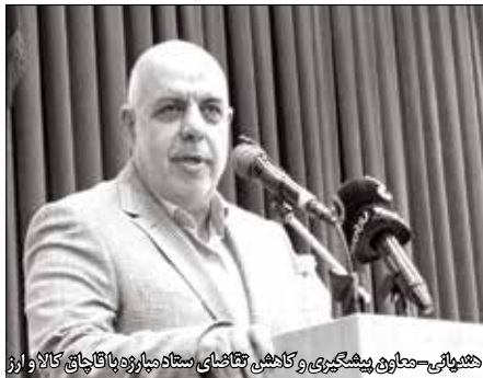
دهشاهی - معاون پیشگیری و کاهش فتنه‌های سهام‌داران و بازاریان کالا و ارز